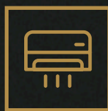
klimatyzacja i wentylacja